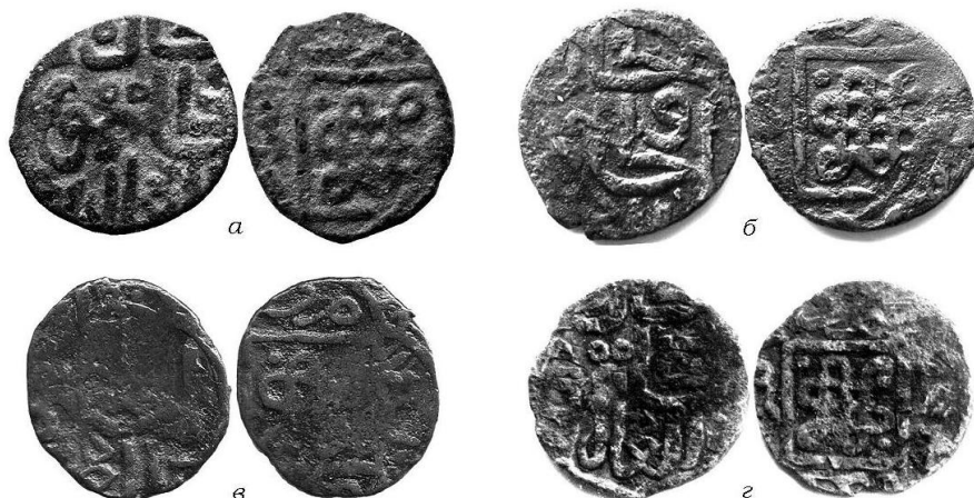
Рис. 5. Пулы 768 г.х.:

а) Zeno #27996; б) Zeno #32124; в) частная коллекция; г) частная коллекция (перечекан)