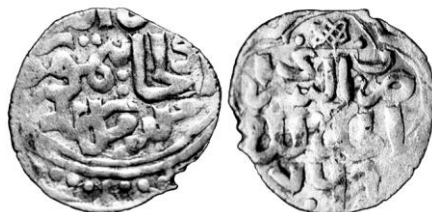
Рис. 1. Данг 769 г.х. из Новоказанкинського клада

Несмотря на скромные размеры клада, его состав представляет значительный научный интерес (см. ПРИЛОЖЕНИЕ). В нём представлена продукция монетных дворов Сарай ал-Махруса, Мохша, Сарай, Хваризм, Сарай ал-Джадид, Гюлистан, Азак. Самая ранняя монета чеканена от имени Гийас ад-дина Токтогу (более известен как Токта-хан; имя Токтогу передано уйгурским письмом) в Сарай ал-Махруса в 710/1311–12 г.; позднейшая монета – серебряный данг 3 с именем «султана правосудного Улджайтимур-хана», указанием монетного двора ас-Сарай ал-Джадид и датой 769, переделанной в штемпеле из 768 (рис. 1) 4 .