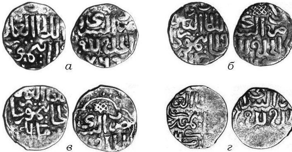
Рис. 2. Данги 769 г.х. из собрания ОН ГЭ: а) инв. № 19230; б) инв. № 19231; в) инв. № 19232; г) инв. № 19233

ни хана (перед лигатурой \text{خ} ) всегда располагается над выдвинутым далеко вправо \text{ج} ; две точки под буквой \text{ي} помещены вертикально; финальный \text{ر} соединён с нижней оконечностью предшествующего \text{و} , а \text{ن} в слове \text{خان} изображён в виде волнистой черты над строкой. По-разному оформлена откидная черта для \text{ك} в слове \text{ملكه} в строке 3: на большинстве дангов это просто изогнутая горизонтальная линия, пересекающая предшествующий \text{ل} , но в одном случае (ОН ГЭ, инв. № 19233) она имеет «куфическую» форму сильно удлиненного \text{ك} . На экземпляре из клада строка 1 почти полностью обрезана краем монетного кружка, отсутствует часть слова \text{خان} хан в строке 2. Монеты ОН ГЭ (рис. 2) также имеют различные дефекты чеканки и обращения, но в совокупности все элементы типа восстанавливаются полностью.