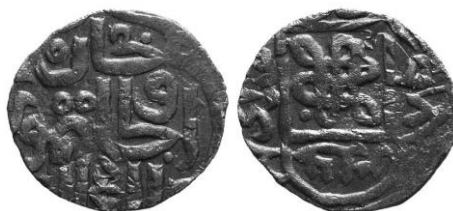
Рис. 6. Пул 768 г.х. (Zeno # 34434, перечекан)

Судя по внешним данным, монета, описанная Н.П. Загоскиным, ничем не отличается от остальных пулов описанного типа, из чего следует, что она тоже чеканена в Сарай ал-Джадиде, а ошибка в атрибуции вызвана неполной сохранностью надписей.