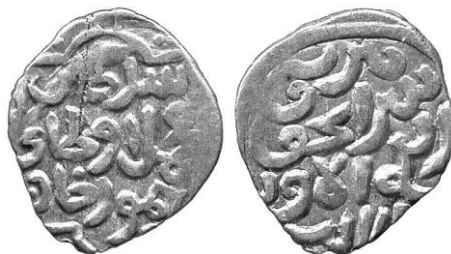
Рис. 4. Данг Сарайчука с датой раби' ал-аввал 7[70] г.х. 16

Чекан / Сарайчука / раби' ал-аввал / 7[7] ... (внизу обрезано). Всё в линейном круговом ободке.